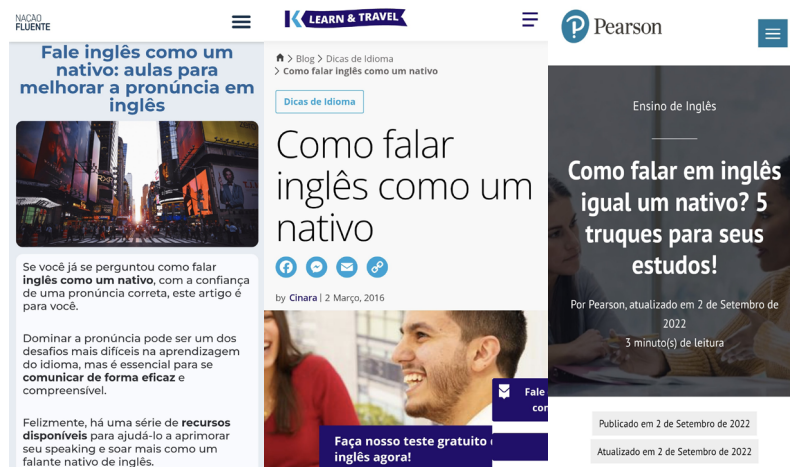
Figura 5 - Artigos em sites para ensino de inglês

Fontes: https://www.nacaofluente.com/blog/fale-ingles-como-um-nativo/ , https://www.kaplaninternational.com/br/blog/dicas-de-idioma/como-falar-ingles-como-um-nativo , https://english.pearson.com.br/blog/ensino-de-ingles/como-falar-em-ingles-igual-nativo