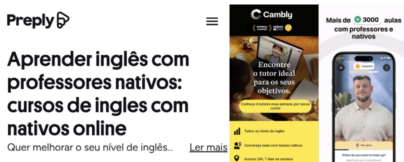
Figura 7 - Plataformas com anúncio de professores nativos