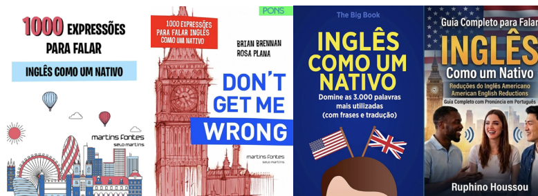
Figura 4 - Livros para o Ensino de Inglês

Fontes: https://www.martinsfontespaulista.com.br/ , https://www.amazon.com.br/ .